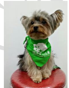
R4 拍攝動物特工證件照片