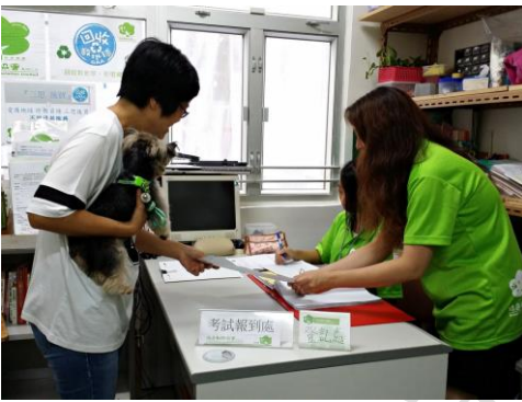
A1.前往【考試報到處】登記