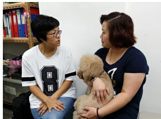
E1.4 往另一場地耐心等待考試結