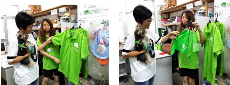
R3 成績合格-登記制服呎碼