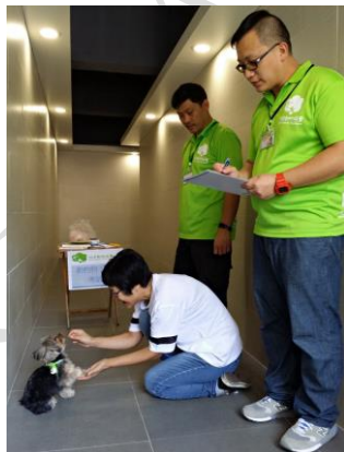
E1.3 給予狗狗服從指令