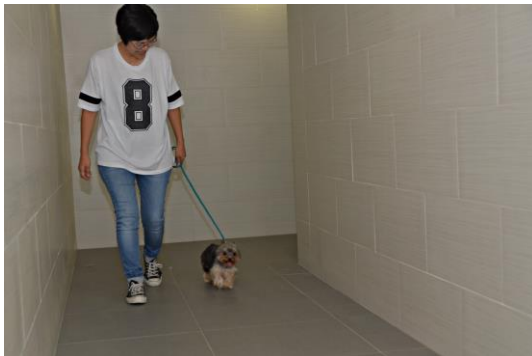
E1.1 行走約 60 英尺