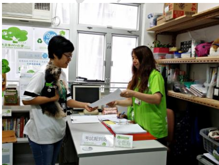
A3.發出考試費用正式收據